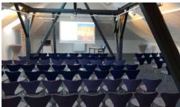
Bestuhlung für 90 Personen mit Leinwand