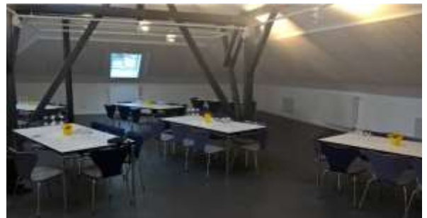
Bestuhlung für 48 Personen