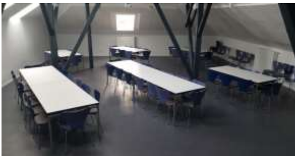
Bestuhlung für 60 Personen