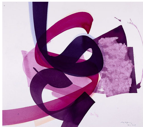
Verve 17 | 55 x 65 cm | Tusche auf Bütten 300g | Aatifi 2023