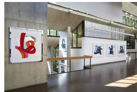
Alphabet der Malerei, Einzelausstellung im Herforder Kunstverein, Herford, 2019