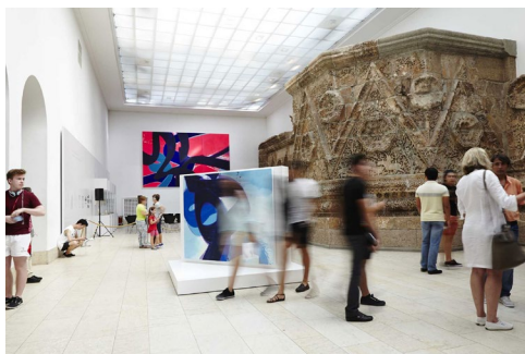
Aatifi – News from Afghanistan, Einzelausstellung im Museum für Islamische Kunst im Pergamonmuseum, Berlin, 2015

1989 Aatifi, Universität Kabul, Kabul, Afghanistan [E]